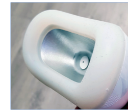
- 120 mm 360° -

Une rentabilité maximale: possibilité d'utiliser 4 applicateurs simultanément avec des paramètres totalement indépendants.