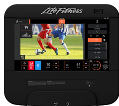
CONSOLE DISCOVER ST