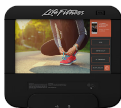
CONSOLE DISCOVER SE3 HD

La série Elevation comprend les choix de console suivants :